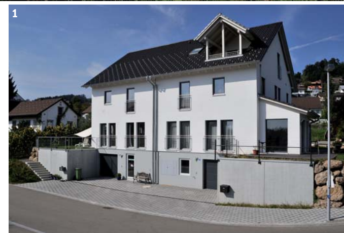
Foto gross+1) Das Doppelhaus bietet zwei Familien viel Platz. 2) Hier wird für die fünfköpfige Familie gekocht.

Auszug aus der Zeitschrift DAS EINFAMILIEN HAUS erschienen am 25. Juli 2013 ©Etzel Verlag AG