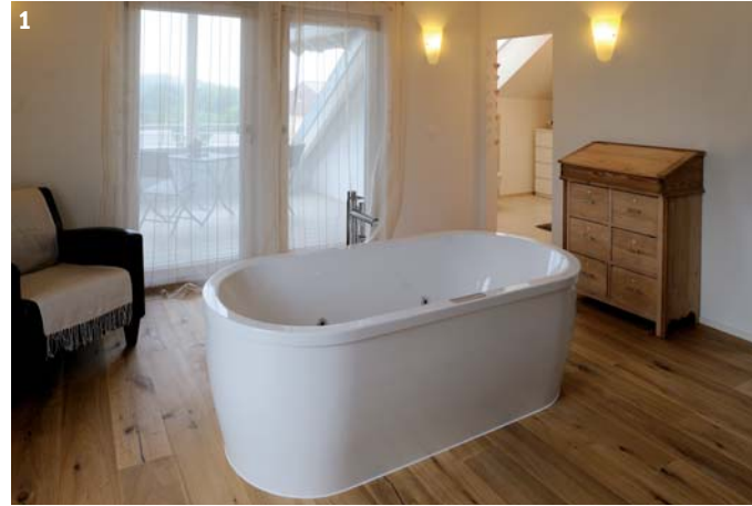
Foto gross) Geräumig und dank der Kombination von Holz und Weiss sehr wohnlich: die Küche. 1) Im Schlafzimmer steht dieser Whirlpool und bietet Raum für Erholung. 2) Im eigenen Bad haben die Eltern Privatsphäre. 3) Die Holztreppe verbindet die drei Geschosse.